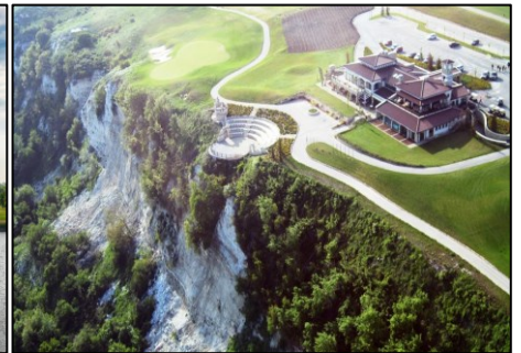
Thracian Cliff Golf Course